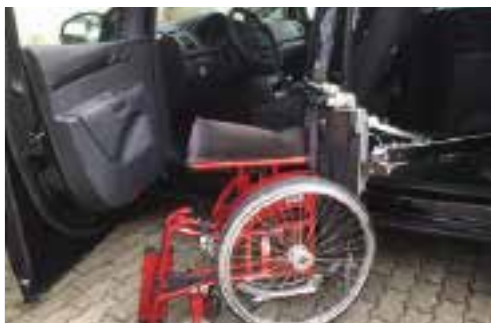
VW Caddy / 3 Sitze + Rollstuhl