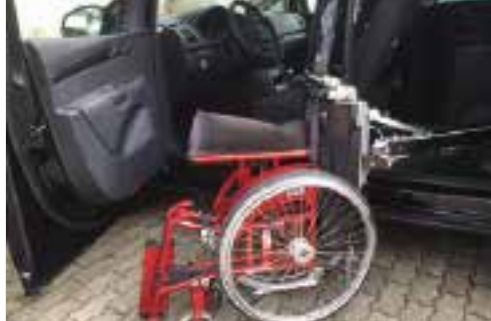
VW Caddy / 3 Sitze + Rollstuhl